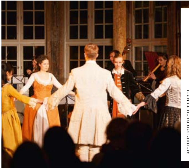
WORKSHOP BACH TANZT!

Eine Veranstaltung der Hochschule für Musik FRANZ LISZT Weimar