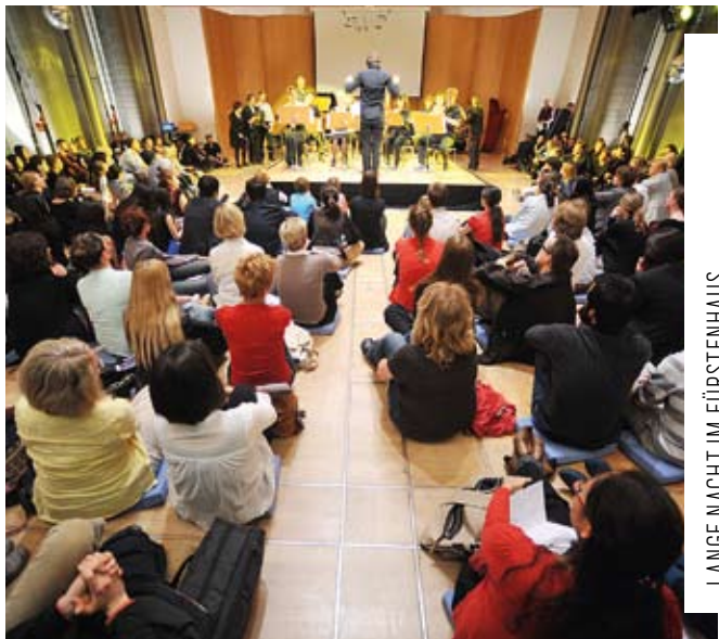
LANGE NACHT IM FÜRSTENHAUS

SAMSTAG, 3. MAI SATURDAY, 3 MAY Weimar | Fürstenhaus | 21:00