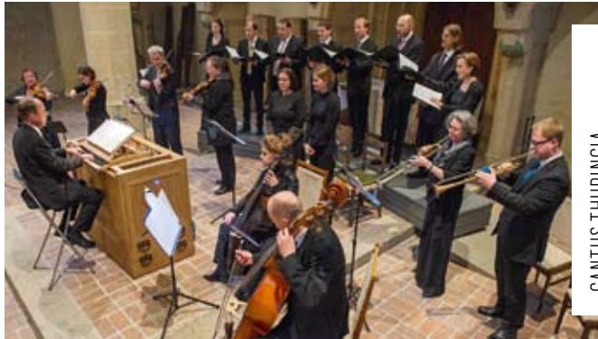
* in Kooperation mit der Hochschule für Musik und Theater Hamburg

FREITAG, 2. MAI FRIDAY, 2 MAY Weimar | Weimarahalle | 17:30